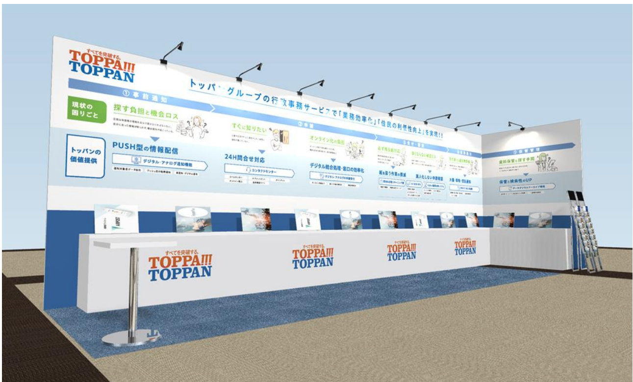
TOPPAN グループ ブースイメージ

「地域×Tech 東北」は、持続可能な地域づくりのために企業と自治体を直接結びつけるマッチング機会の提供を目的とした展示会です。TOPPAN グループブース(仙台国際センター展示室・小間番号 3-4、3-6、3-8)では、「行政サービスのあるべき姿の実現を支援する」をテーマに、業務効率化と住民の利便性向上を実現する TOPPAN グループのソリューションや取り組み事例を一堂に集めて紹介します。