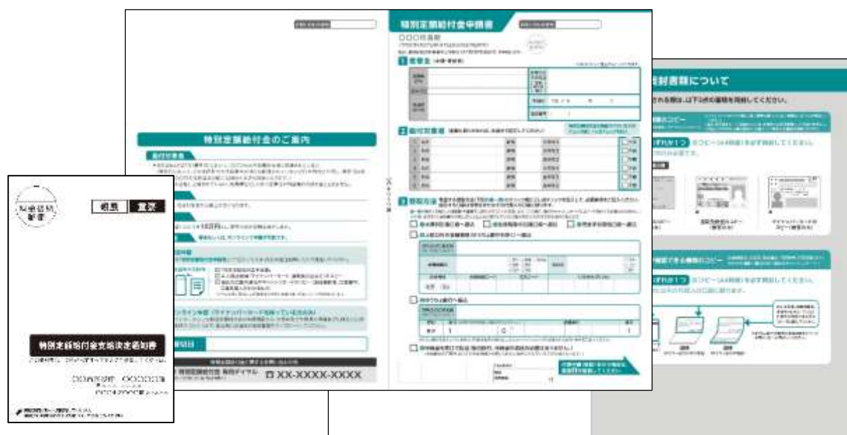
提供するデザインテンプレートの一部

デジタルハイブリッドのトッパン・フォームズ株式会社（以下トッパンフォームズ）は、新型コロナウイルス感染症に関する特別定額給付金事業の実施に伴い総務省より提示された「郵送用 申請書」および「決定通知書」について、申請方法の理解度のさらなる向上や記入漏れなどを起こりにくくするための工夫を施したデザインテンプレート（以下、本テンプレート）の自治体向け無償提供を本日より開始いたします。