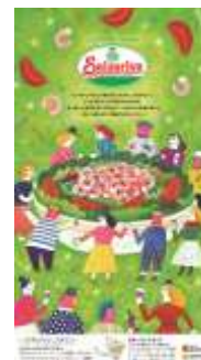
▲研究題材のメニューブック