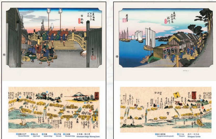
浮世絵&古地図パネル(デジタルアートプリント)

歌川広重によって描かれた浮世絵「東海道五十三次」を東海道の古地図「東海木曾両道中懐宝図鑑」とともにお楽しみいただけます。